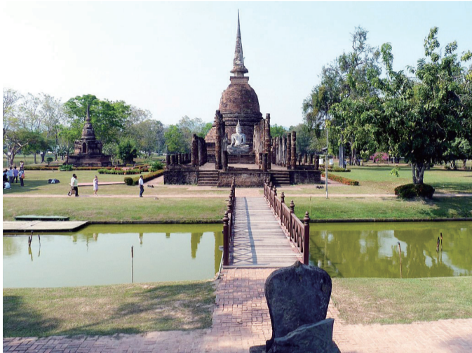
▲素可泰歷史遺蹟公園內的沙西寺。

【本刊訊】沙西寺(Wat Si Si)，位於泰國素可泰遺蹟公園裡的佛寺遺址之一。沙西寺座落於公園湖泊的小島上，周邊湖水與翠綠地環繞，是一座錫蘭風格的佛塔，又稱為「藝術風格」。