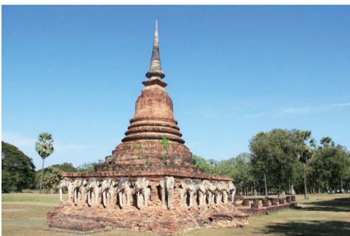
▲素可泰歷史遺蹟公園內的索拉薩克寺。

【本刊訊】索拉薩克寺(Wat Sorasak)，位於泰國素可泰遺蹟公園的中區，建於一四一二年，由暹羅羅蘭三世、拉薩克寺風格較具規模和氣勢，其方形基座上有二十四頭白色大象，上面則為具斯里蘭卡覆鉢色彩的佛塔。