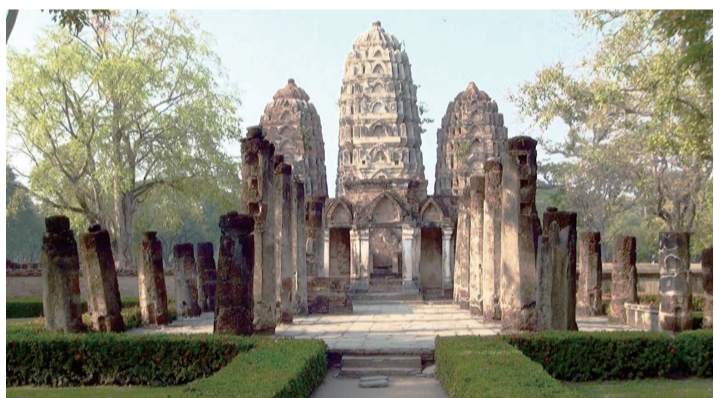
▲素可泰歷史遺蹟公園內的西沙瓦寺。

【本刊訊】西沙瓦寺(Wat Si Sawai)，位於泰國的素可泰歷史公園，主建物は三座高棉式的玉米塔。塔上浮雕，多是印度教的毗濕奴和天龍。