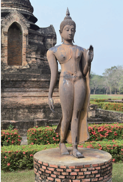
▲沙西寺的行走佛像身姿曼妙。